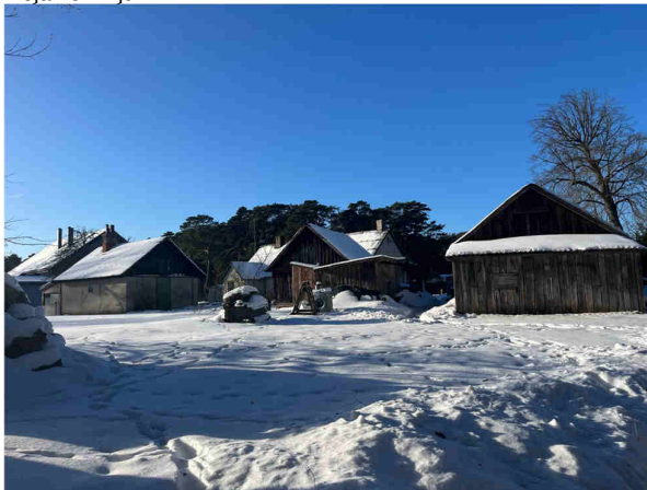
Skats uz palīgkām