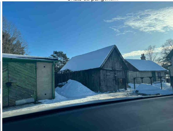
Skats uz palīgkām