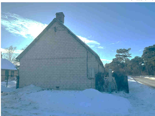
Skats uz dzīvojamo māju